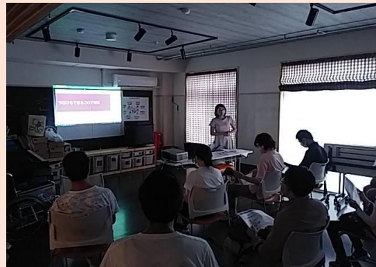
20名の介護スタッフが参加