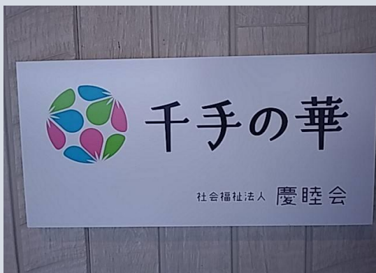
千手の華ディサービス