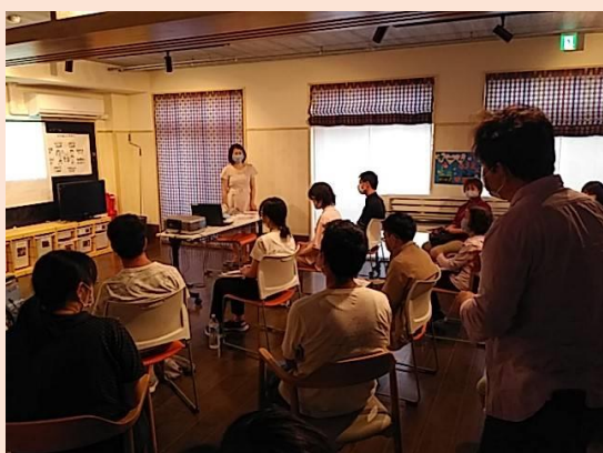
質疑応答は現場ならではの質問がありました。